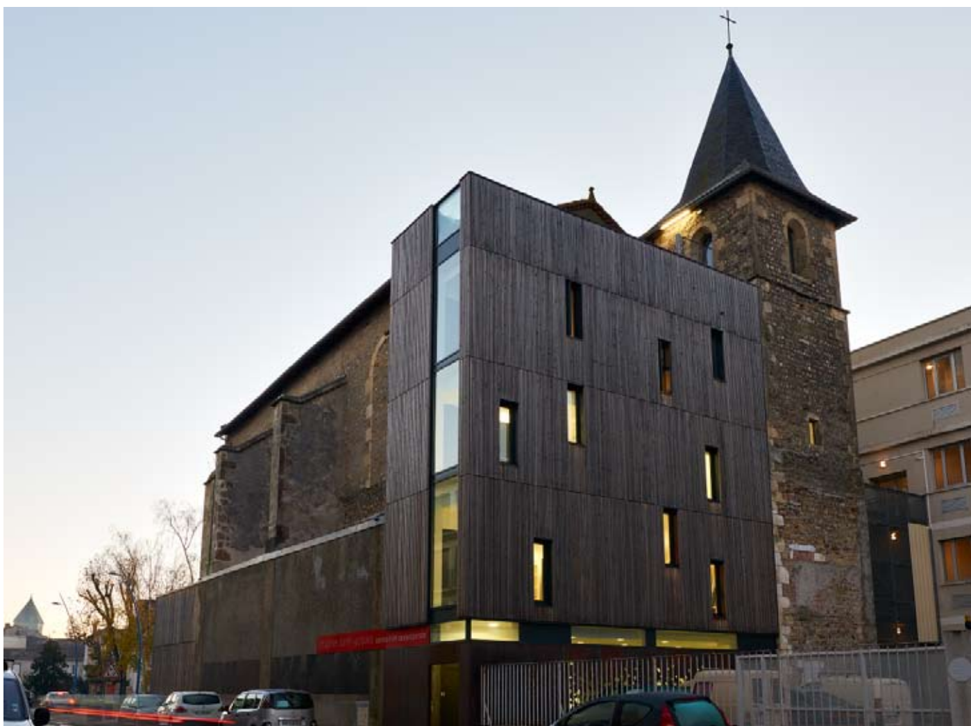
Photographies - centre d'art contemporain Chapelle Saint-Jacques