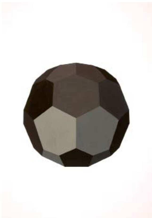
The old Boys Club Le Prophète Triangle

Avenue du Maréchal Foch – 31800 Saint-Gaudens +33(0)5 62 00 15 93 – chapelle-st-jacques@wanadoo.fr www.lachapelle-saint-jacques.com