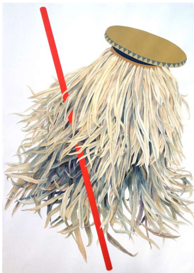
The old Boys Club Celui qui rend hommage aux ancêtres

Chapelle Saint-Jacques centre d'art contemporain