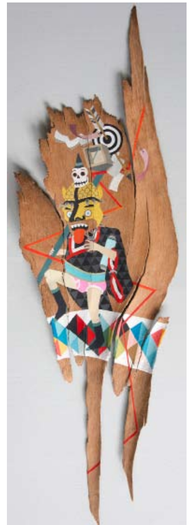
The old Boys Club Celui qui rend hommage aux ancêtres © The Old Boys' Club

The old Boys Club L'anachorète velu © The Old Boys' Club